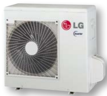
Buitenunit (Multi Split)